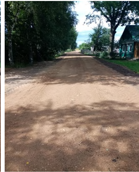
До начала проведения работ