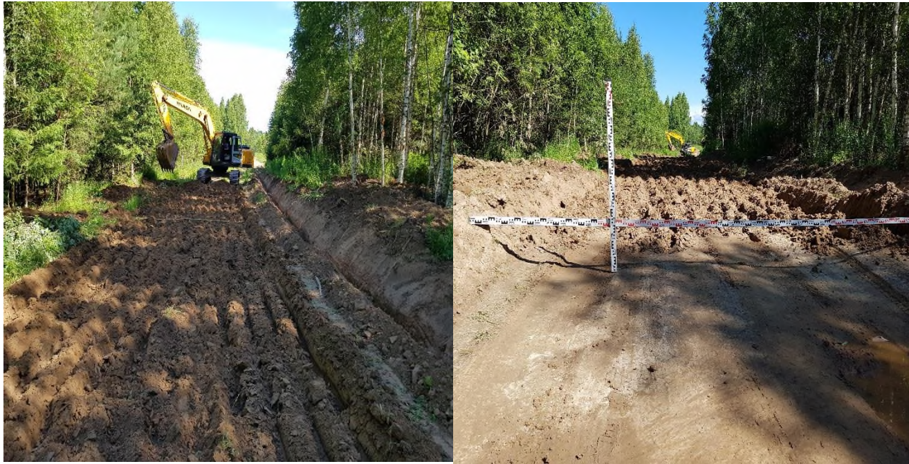
До начала проведения работ

Объем финансирования по 2519,496 тыс. руб. (ОБ - 2015,5968 тыс.руб., местный бюджет - 503,8992 тыс. руб.)