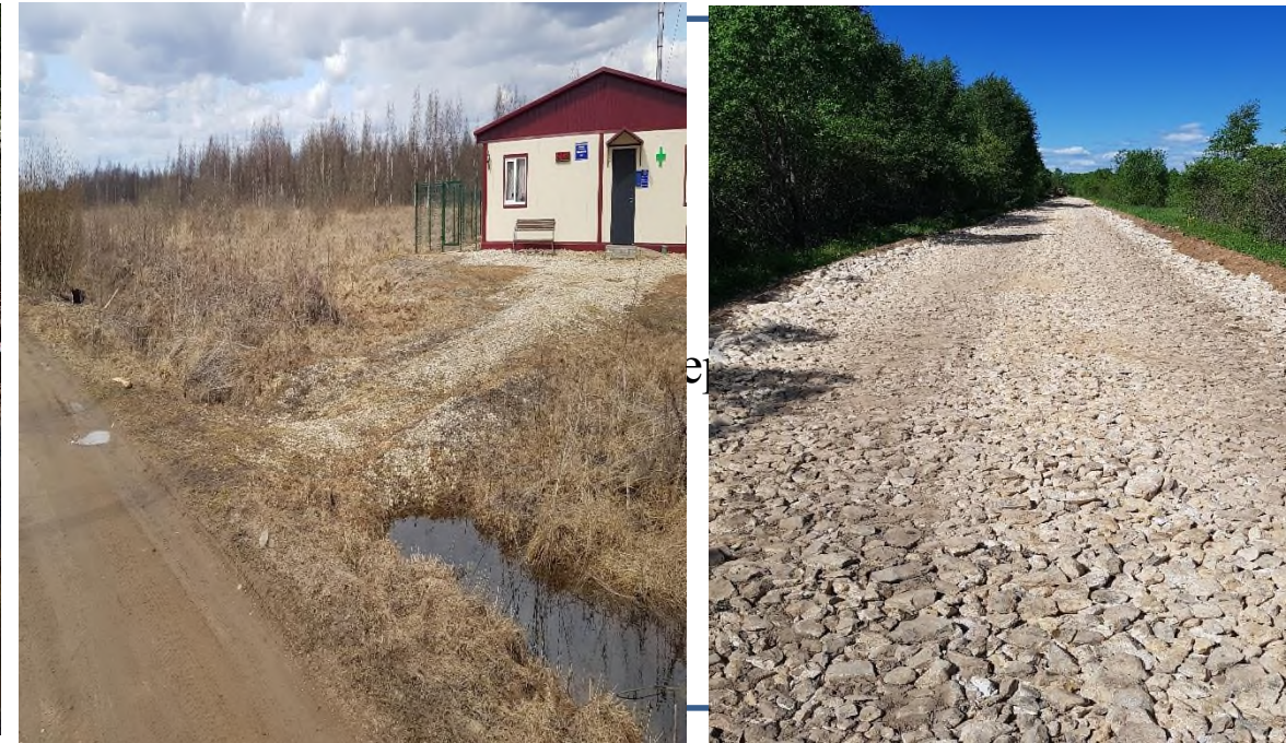
После проведения работ

Ремонт автомобильной дороги д. Муравьево-д. Пеленичено сельского поселения «Хорошево» Ржевского района Тверской области. Процент достижения на отчетную дату – 100 %.