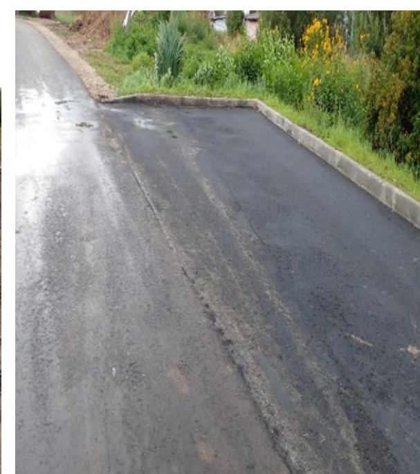
До начала проведения работ